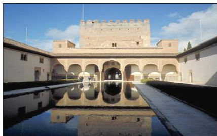
photo taking stop. Later on, proceed to the most Moorish influenced city, Granada. Visit to the exquisite Alhambra Palace, former residence of Moorish kings, will be the highlight in the afternoon (Remarks: In case

Leave Costa Del Sol for Malaga, the birth place of Pablo, possibly the world's most famous artist, for a